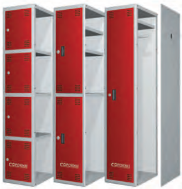
Рисунок 1. Сборка изделия